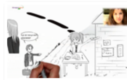
Een animatie maken met VideoScribe.

Zie als leraar niet overal problemen. Sta juist open voor verrassingen en voor creatieve oplossingen en benut ze. Zie ze dus als een nuttige toevoeging en niet als te mijden hindernissen (uit: Vijf principes van effectuation ).